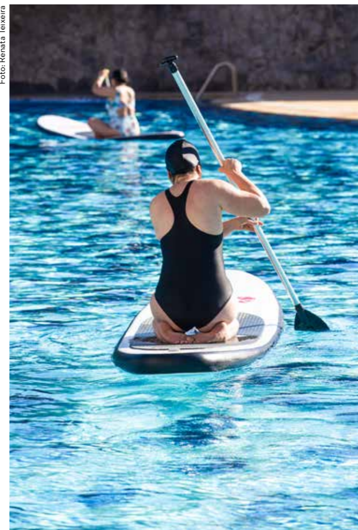
Stand up paddle dia do desafio - Sesc Belenzinho