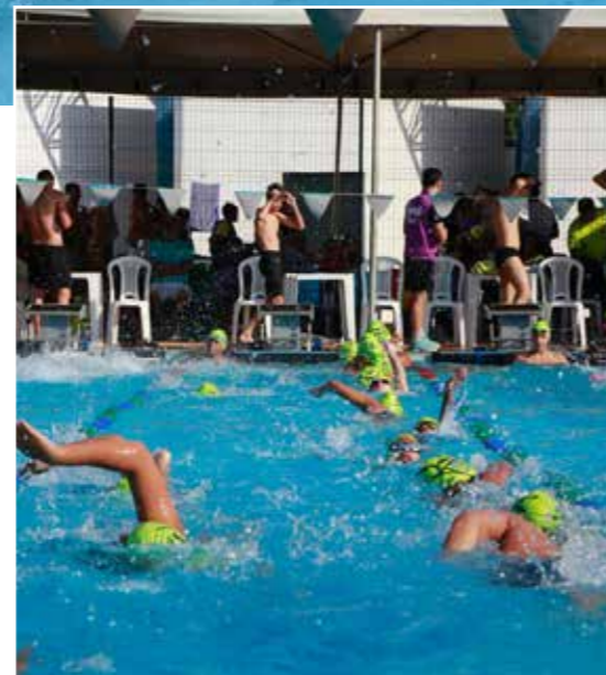
Alunos participam das aulas do Projeto Nós Podemos Nadar