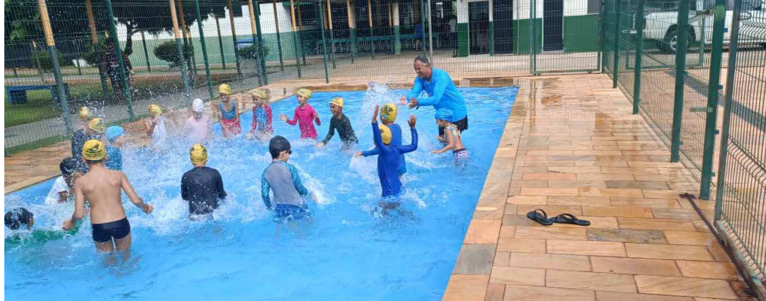
Projeto atende a crianças e adolescentes da região