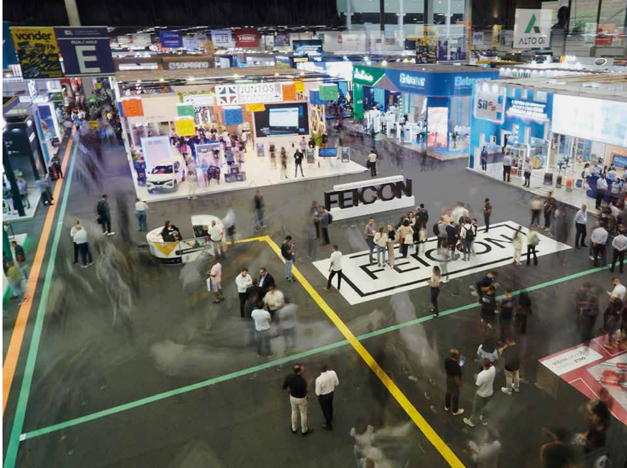
Feira acontece em abril em São Paulo