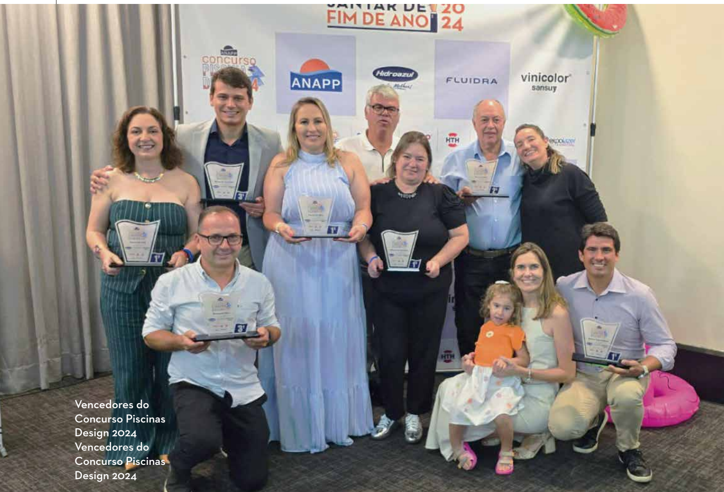
Vencedores do Concurso Piscinas Design 2024 Vencedores do Concurso Piscinas Design 2024